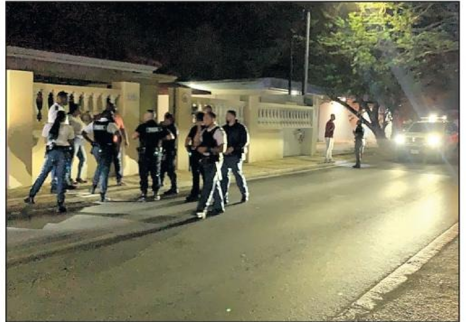
Diabierna anochicos a bay full for di man na arendstraat, entre bisijnanan, tiramento di baranca, machete, biga etc. dos persona deteni y un herida na cabes, basta polis a yega